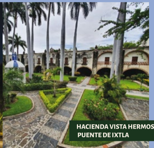
HACIENDA VISTA HERMOSA PUENTE DE IXTLA