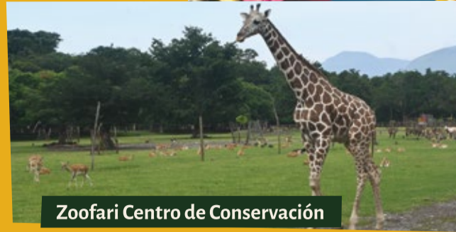
Zoofari Centro de Conservación