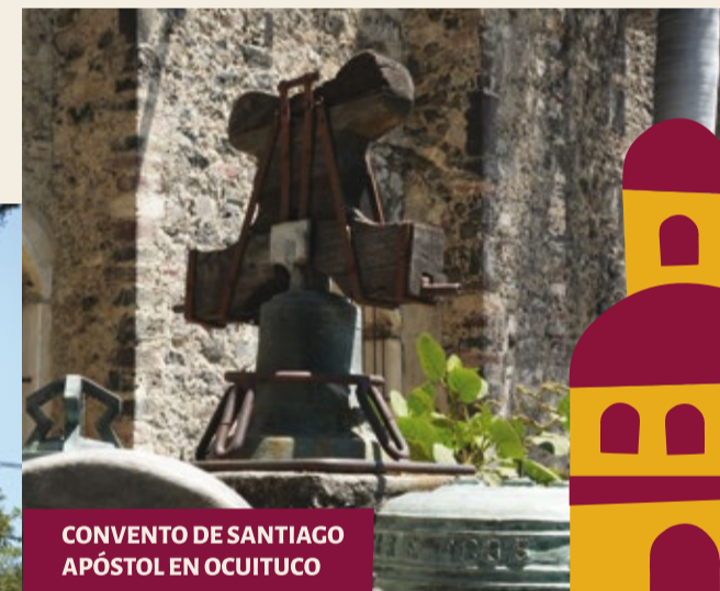
CONVENTO DE SANTIAGO APÓSTOL EN OCUITUCO