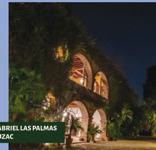
SAN GABRIEL LAS PALMAS AMACUZAC

Arquitectura, naturaleza y tradición en cada rincón de Morelos.