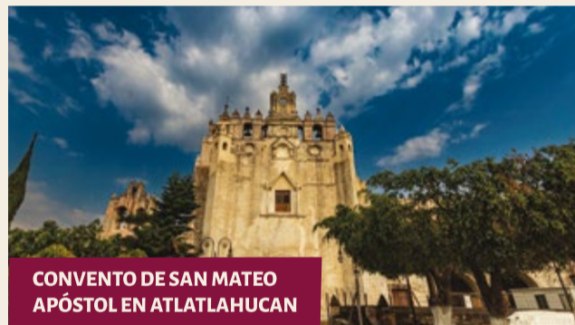
CONVENTO DE SAN MATEO APÓSTOL EN ATLATLAHUACAN