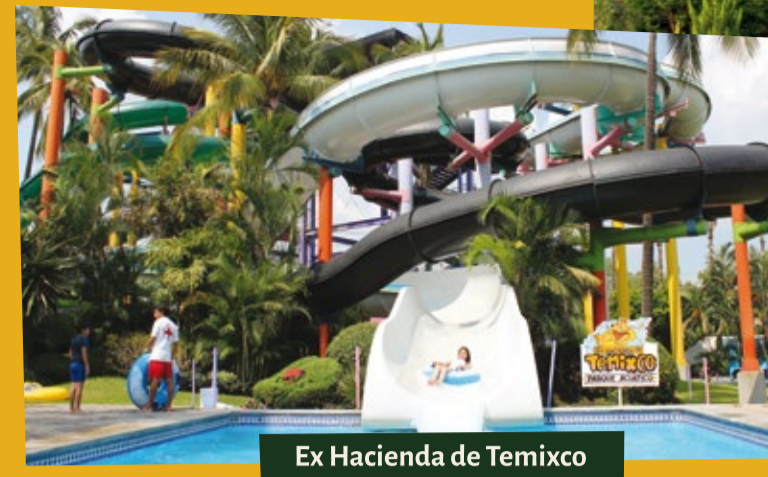
Ex Hacienda de Temixco