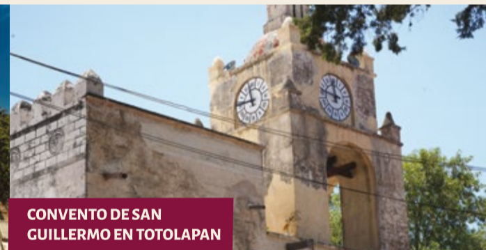
CONVENTO DE SAN GUILLERMO EN TOTOLAPAN