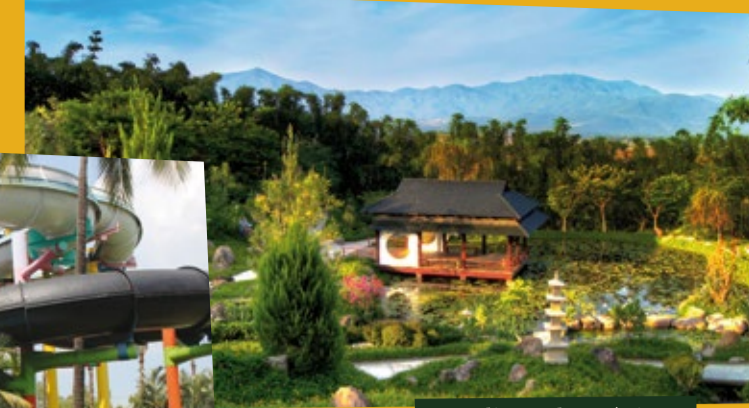
Jardines de México