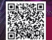
DIRECTORIO COCINERAS TRADICIONALES