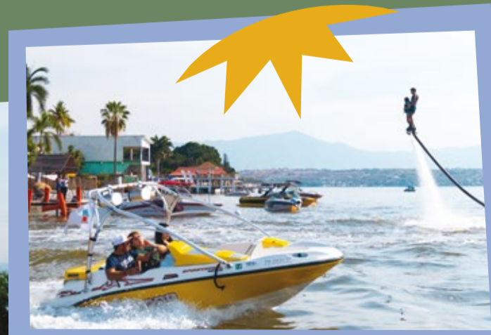
Practica Cable Ski